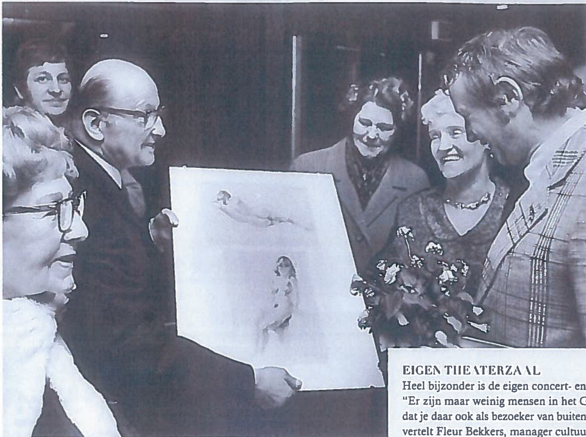
In 1971 gaf Toon Hermans belangeloos een voorstelling in het theater van het Rosa Spier Huis. Als dank mocht hij een kunstwerk uitzoeken.

Er wordt een geheel nieuw Rosa Spier Huis gebouwd in Laren