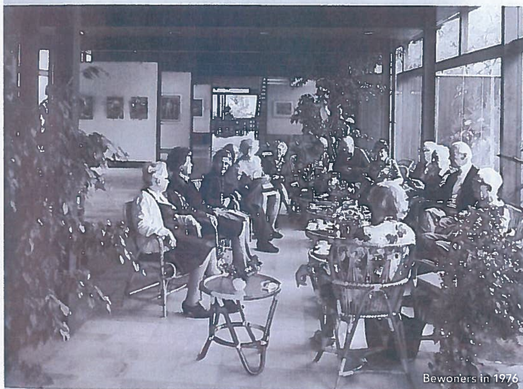
Bewoners in 1976