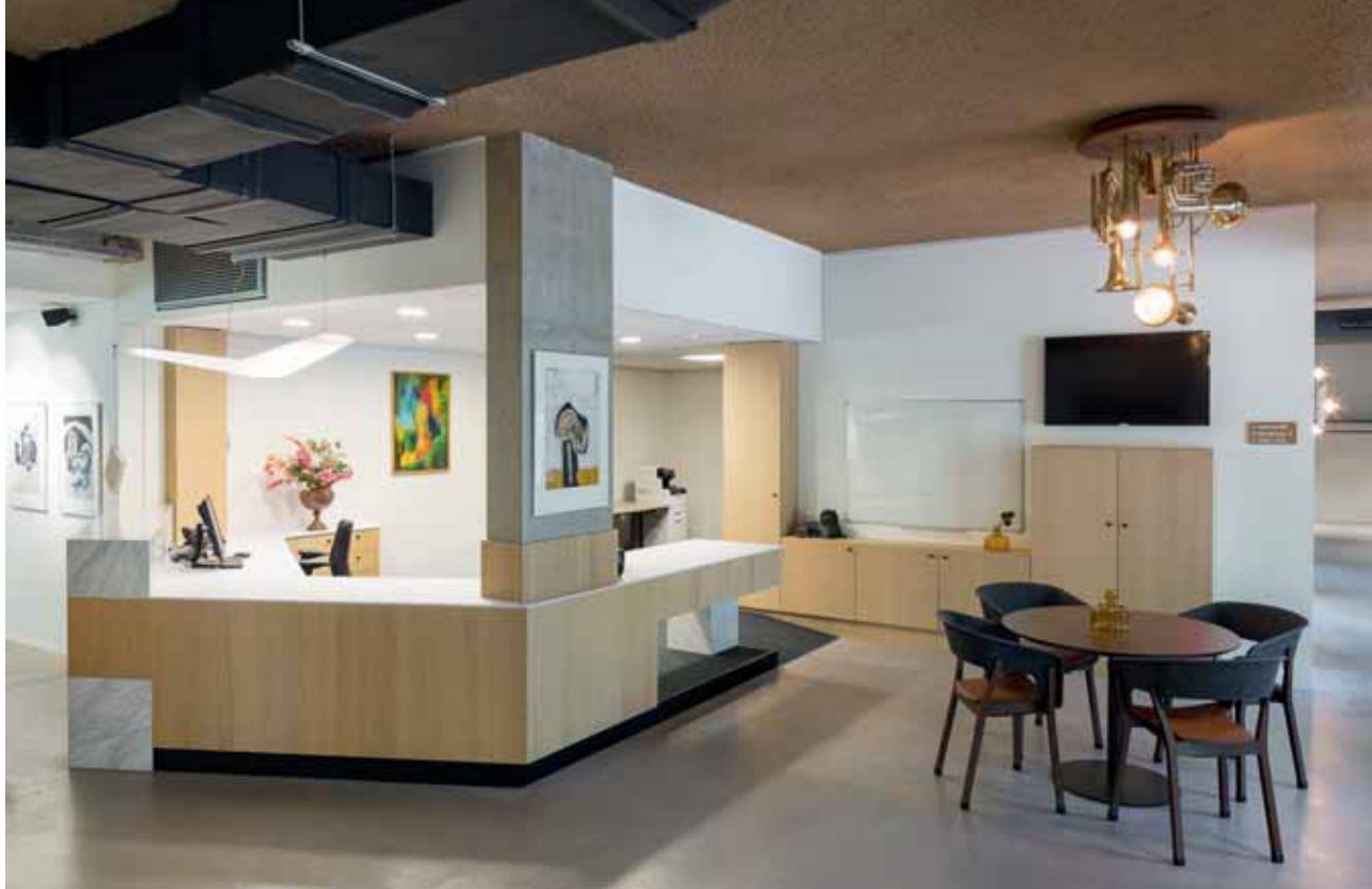
FOTO ONDER Het Galericafé, met bij de ingang een vleugel en panelen voor schilderijen waarop wisselende exposities zijn te zien.