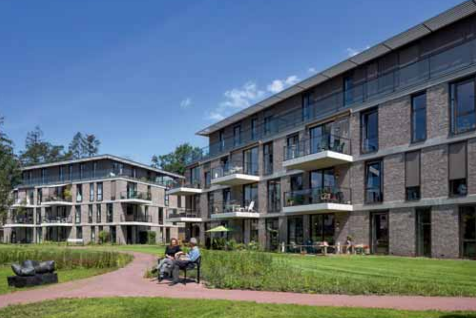
FOTO LINKS De Anna Stibbezaal.